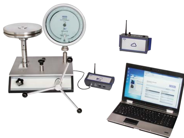
Модели CPU6000-W, CPU6000-S, CPB5800 и ПК с программным обеспечением Wika-Cal

С помощью калибратора модели CPN7000 можно загружать результаты тестирования выключателей из прибора и заносить их в протокол через Wika-Cal. Данное тестирование выключателей функционально доступно только для CPN7000.