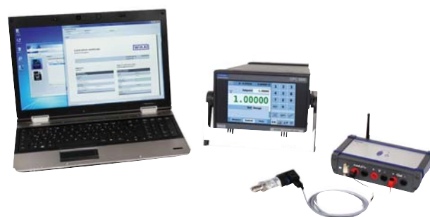
WIKa-Cal с пневматическим калибратором модели CPC3000 и датчиком давления с CalibratorUnit модели CPU6000-M

Более подробная информация о различных пневматических калибраторах приведена в типовых листах СТ 27.40, СТ 27.55, СТ 27.61, СТ 27.62 и СТ 28.01